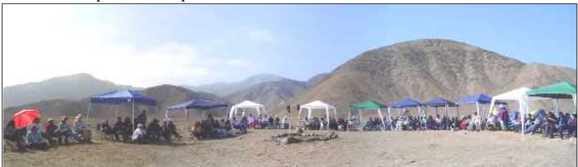
Brilla el sol, todo brilla y reunidos en círculo bajo los toldos irradiamos, ofrecemos a la tierra lo mejor que hay en nosotros y podemos crear.

Al llegar ya todos estaban levantados y nos preparamos para ir por el camino hacia la parte posterior en "Los anillos de Saturno" allí nos reunimos sobre una gran figura formada con piedras sobre el suelo, un gran sol con un corazón en el centro. Estando todos dentro iniciamos una meditación solar con nuestro nombre cósmico; luego de un tiempo llegan a mi mente muchos rostros no humanos que se van diluyendo hasta quedar mi mente en calma. Luego hicimos una sanación al planeta, envolviendo a todos los seres en luz, en especial nuestras familias finalizando con un abrazo general, creando aún más lazos de amistad entre todos. Regresamos por el camino y en el campamento realizamos una ofrenda o pagamento a la tierra en gratitud por todo lo recibido y para sanar y transformar el pasado en el presente.