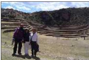
De la tierra al cielo...somos uno y Dios en todos.

Allí donde hace unos años se dio un encuentro mundial, hicimos una labor descendiendo hasta el círculo inferior y estando los cuatro se nos unieron una mujer de argentina y una familia peruana, padre, madre y sus niños, acompañándonos en el acto de bendición y agradecimiento que estábamos realizando.