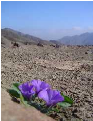
Lo más sencillo...con la fuerza de la tierra, un regalo, un mensaje, un compromiso mayor...

Agradecí al desierto, a sus montañas, a su arena y sus piedras angulosas y en especial a esas flores con las que compartí lo mejor que llevaba conmigo, el agua y mis sentimientos. Luego estando de pie me dirijo hacia los cuatro rumbos atrayendo la luz e irradiando hacia el Este violeta y amarillo, hacia el Norte celeste y verde, hacia el Oeste índigo y naranja y hacia el Sur rojo rosado con todas las virtudes de cada vibración, sintiendo luego que ya era tiempo de regresar para integrarme de nuevo al grupo, ya se acercaba la última noche en el desierto.