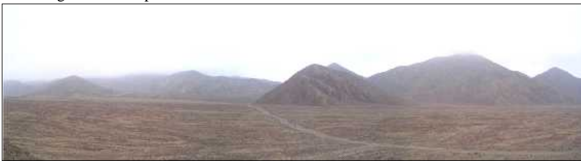
Avanzando hacia "los anillos de Saturno" afuera se vuelve dentro y el silencio un bálsamo.

mantralizando y decidí sentarme a meditar dentro de la carpa y escuchaba entonces un concierto de ronquidos y silbidos de mis vecinos cercanos y lejanos por lo que decidí vestirme, salir y dirigirme hacia un lugar alejado y silencioso. Subí caminando una colina cercana siguiendo por la cima, con mi linterna apagada para no molestar, alejándome cada vez más a través de la noche, sintiéndome en paz, protegido y asistido hasta que ya no escuchaba ni siquiera al grupo que mantralizaba, solo mis pasos. Tomé entonces asiento mirando al este y me dispuse a meditar, respirando y relajándome aún más, sintonizándome con ese silencio profundo que todo lo envolvía en medio de la noche, impulsándome más y más dentro de mi... todo era calma y quietud... unidad... en ese estado de paz en el que todo es perfecto, posible, completo, entero, solo hay un presente y me sentí agradecido con la vida, con la tierra, con todos los seres que nos han guiado y nos guían y comencé a recordar en la luz a mi familia, amigos, seres queridos, uno a uno envolviendo a quienes desde la distancia nos acompañaban y sentí que nadie quedo por fuera, todos éramos uno. Sentí luego pájaros volando cerca, abrí los ojos, ya era de día y decidí regresar al campamento.