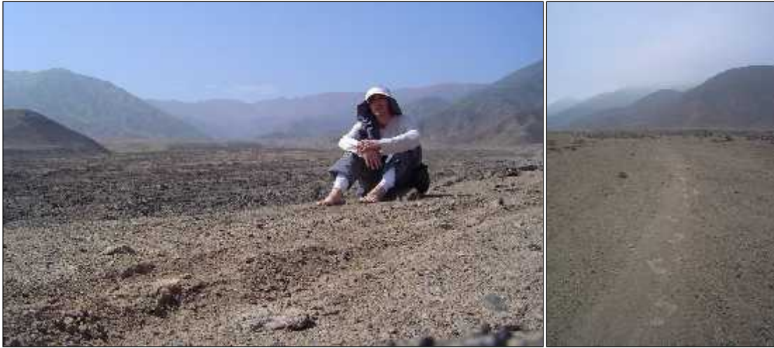
Árido, silencioso. Cálido con mis pies, cálido con mi alma.

Caminé sin tiempo, integrándome a la inmensidad de aquel valle de arena y piedra bajo un cielo azul celeste y de repente serenamente comencé a llorar como llorándole al desierto y al cielo, sentí que en ese lugar inmenso me vaciaba y el desierto silencioso me escuchaba para expandirme hacia algo nuevo y superior, manifestándole nuevamente al universo mi deseo de servir, servir a un plan divino, superior y luminoso para conocer los designios de Dios, sus mandatos y realizar mi existencia. Descansé en paz avanzando descalzo sobre la arena fina, suave y tibia, orando y agradeciendo el estar ahí presente en este momento tan especial de la tierra.