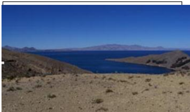
Lago Titicaca Na cordilheira dos Andes a uma altura de 3.810 m estende-se pelo sudeste de Peru e o oeste da Bolívia, transformando-se na principal artéria de comunicação entre os dois países.

Sem dúvidas, a recordação à flor da pele do grande compromisso assumido em outros tempos se faz presente cada vez com maior intensidade nos corações daqueles que desde tempos imemoriais muitas vezes fizeram de sua vida uma entrega constante ao serviço