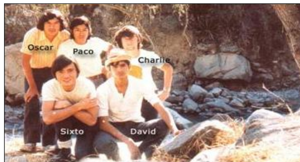
Saída de campo nos começos da Missão Rahma - Peru

"O Vale da Lua Azul é um lugar de árduo trabalho ao qual chegam todos os discípulos da Fraternidade Branca quando é seu momento... Todo irmão deve estar onde possa cumprir sua missão" (Informe inicial de Missão Rahma)