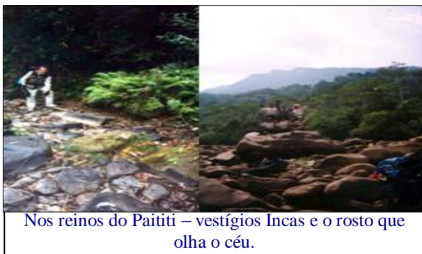
Nos reinos do Paititi – vestígios Incas e o rosto que olha o céu.

"...Este ano serão alinhados os discos solares, de tal maneira que começarão a vibrar em unísono. Por este motivo é importante a viagem prevista este ano para Paititi e a reunião dos Ramos em Cusco durante o mês de Agosto, dias antes da viagem. Certamente haverão de estar ali neste especial momento os 144, um número de nascimento de algo novo, de peregrinação e de preparação, de unidade e de sabedoria..." (Oxalc, 25-01-2005)