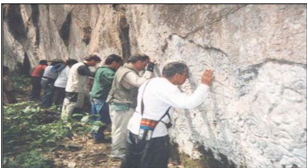
Parede de Pusharo, camiho ao Paititi. Peru 2005

"...A viagem planejada ao Paititi ativará em cada irmão o compromisso assumido em vidas