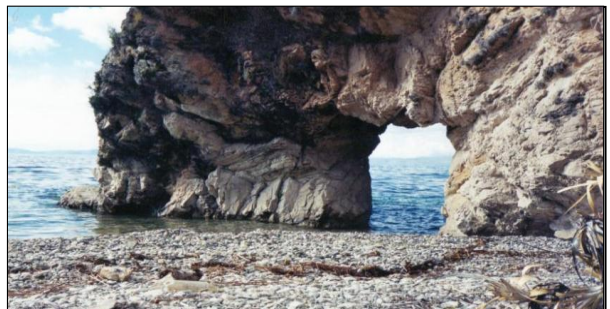
Porta que dá a Cidade Perdida – Ilha do Sol Lago Titicaca - Bolívia

Curiosamente lembremo-nos de que o Disco Solar (que hoje se encontra no Paititi), emergiu dos retiros interiores da Fraternidade Branca localizados no Lago Titicaca e dali foi levado a Cusco, onde permaneceu até os tempos da conquista. Assim mesmo, o primeiro INCA, Manco Capac (primeiro monarca do Tawantinsuyo), segundo a lenda, começaria sua missão viajando da Ilha do Sol até o norte, para posteriormente fundar a cidade de Cusco e assim dar origem ao denominado Império do Sol.