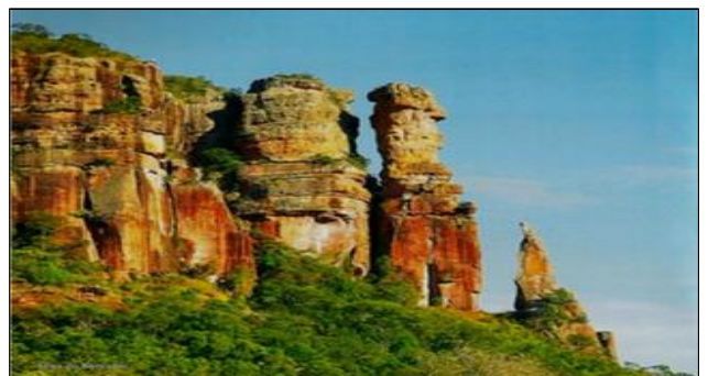
Serras do Roncador – Mato Grosso Brasil

Quando a expedição se encontrava no lugar que deviam percorrer na zona do Mato Grosso, Brasil, e ante a pergunta do que se esperava nas serras, recebeu a seguinte mensagem: