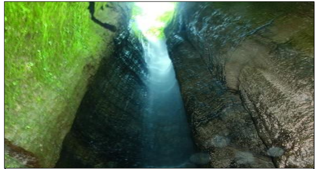
Cueva de los Tayos – Equador A 800 metros, situa-se a entrada que é conhecida para esse mundo subterrâneo, cujo acesso consiste numa boca de entrada de 2m de diâmetro e um túnel vertical de 63m de profundidade.

Para esse momento se coordenaram três expedições simultâneas. Elas se realizaram na região do Paititi na Amazônia oriental do Peru, na Cueva de los Tayos na região fronteira entre Equador e Peru e na Serra do Roncador, em Mato Grosso – Brasil.