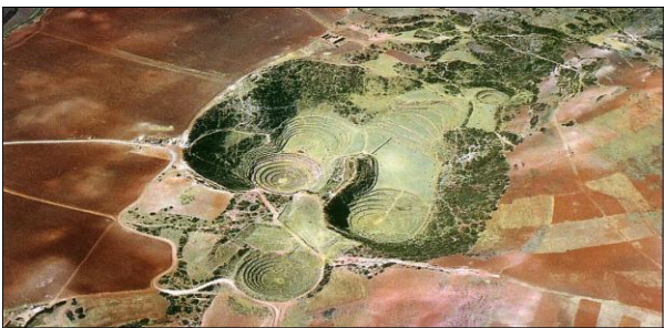
Círculos de Moray - Peru

Algumas comunicações recebidas para aquela oportunidade: