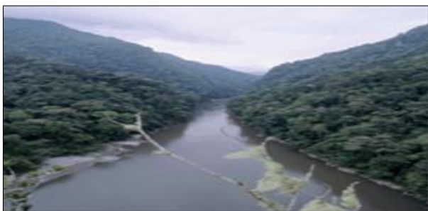
Em direção ao Paititi - Río Sinkibenia - Peru

"Aqueles que vão manterão unidos e expectantes a todos os Rahmas do planeta. Quando chegarem a seu destino, os 22 restantes o saberão, porque o experimentarão estejam onde estiverem, começando a atuar imediatamente e todos unidos em comunidade mental cerrarão fileiras em torno da mensagem" Oxalc. (Comunicação: 10-02-1990)