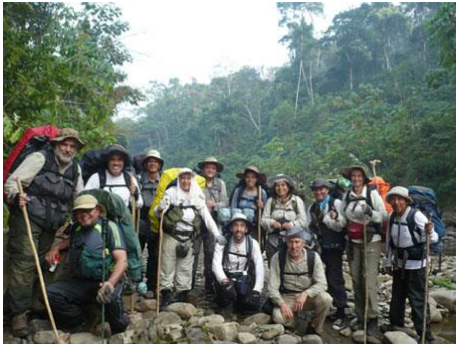
El grupo en Paititi