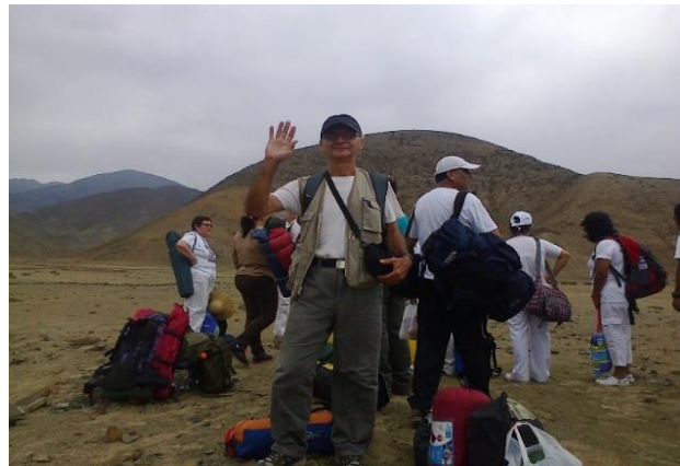
Llegamos a Chilca

Llegamos a la 1:30 p.m. y de inmediato se dispuso los lugares dónde se deberían armar las carpas, no faltó algunos que se sintieron incomodos y protestaron por ser reacios a guardar y mantener el orden dispuesto por la Organización.