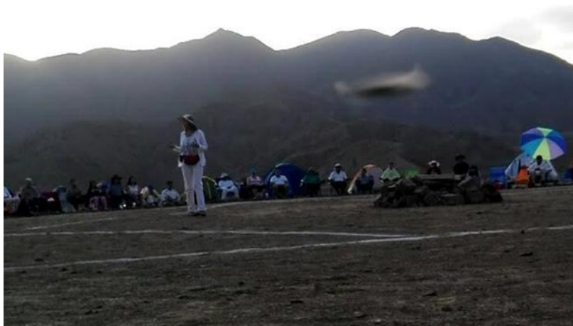
Intervención de Patries, nótese el objeto captado cruzando el desierto

Luego siguieron la presentación de cada persona indicando nombre y procedencia del lugar de origen; se hizo el conteo resultando en ese momento 142 presentes, luego llegaron 4 hermanos más con los que completamos a 146. Continuó mantralizaciones, meditación, recepción de comunicaciones, y luego por Patries de Holanda dirigió un trabajo por el amor.