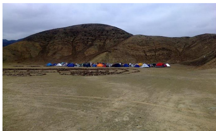
Armamos las carpas al pie del cerro 42

Armados las carpas alrededor del círculo que demarcaba la estrella de 6 puntas.