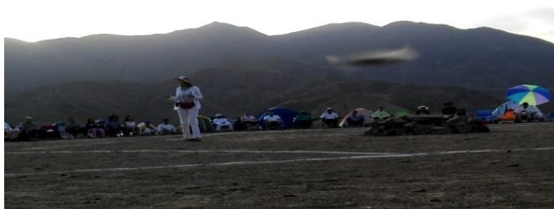
Patries dirigiendo una meditación solar y a la derecha posando una nave estilo mantarraya o rod. Una de tantas que se dejaron fotografiar.

Concluyo este encuentro con los hermanos del universo, donde a través de mí se dirigen al pueblo de México, en éste sentido: “Lo alto a dispuesto que vosotros que sois hijos del tiempo nuevo renazcan de las cenizas encontrando la paz de su corazón, aliviado y aliviándolo de cargas inútiles... poned el ejemplo de cambio –en uno mismo- para que con la llama de la luz verdadera que mora en su interior, surja el despertar, os decimos que a bien nuestro amigo, ha escrito que va dedicado el presente a la madre tierra y con ello a sus hijos que son los pies de los que se creen la cabeza (los actuales políticos o gobernantes) que en todo caso sí lo son, está perdida; así pues aprovechad y