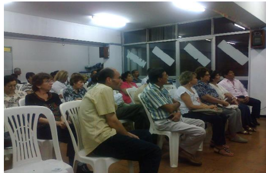
Algunos de los asistentes a la Ceremonia

Luego se nos dio pase a dirigir las palabras a los representantes de cada país participante.