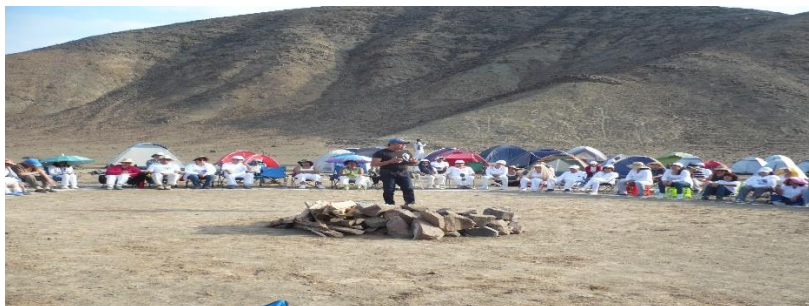
Ambas fotos son en el desierto, en ésta asisto una meditación y es del 24 de Enero de 2016.