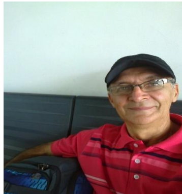
En el Aeropuerto de Pucallpa

Nuevamente desde que se dio a conocer la Invitación para los que deseaban participar de los Eventos en la ciudad de Lima, comencé a ver la posibilidad de participar, para mí nunca es fácil poder estar presente en actividades fuera del lugar donde vivo. Gracias a Dios en muchas oportunidades tocando puertas se me abrieron y encontré el apoyo que requería. Esta vez no fue la excepción. Tanto en lo económico como en alojamiento hubo personas y hermanos en misión que me dieron la mano, por la cual desde ya les estoy muy agradecido y siempre pediré bendiciones por ellos.