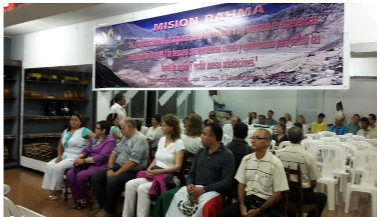
Los representantes elegidos para dirigir las palabras en la Ceremonia

Luego se nos dio pase a dirigir las palabras a los representantes de cada país participante.