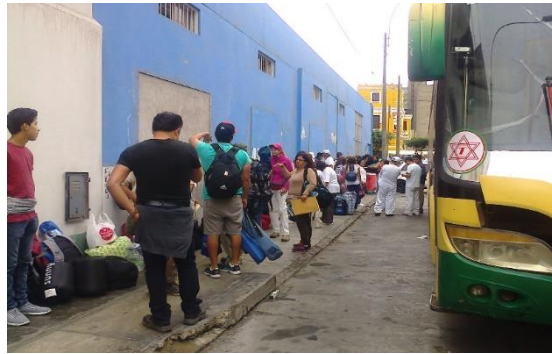
Reuniéndonos para partir en grupo a Chilca

Llegamos a la 1:30 p.m. y de inmediato se dispuso los lugares dónde se deberían armar las carpas, no faltó algunos que se sintieron incomodos y protestaron por ser reacios a guardar y mantener el orden dispuesto por la Organización.