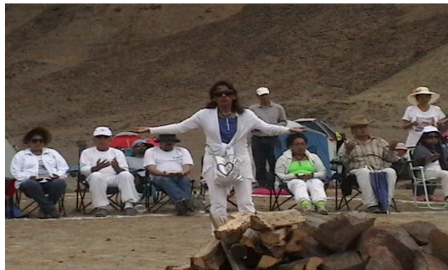
Señorita que realizó la Psicofonía y los hermanos en actitud receptiva