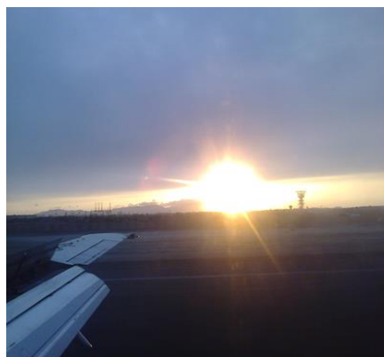
Llegada a Lima, un espectacular Sol me recibe

Desde que llegue a Lima fue muy impresionante ver el cielo despejado y un Sol radiante que me daba la bienvenida, así lo sentí y presentí que todo iba a irme muy bien y no me equivoque, los resultados en todo sentido rebasó mis expectativas.