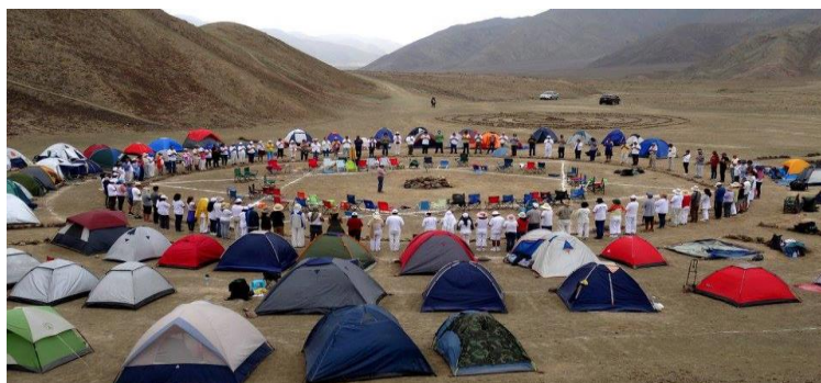
Trabajo dirigido por Miguel Morales