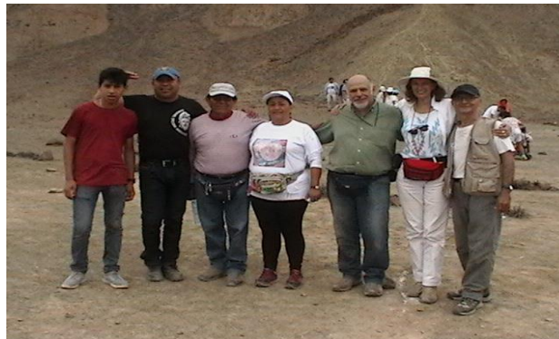
Los 7 hermanos en afinidad y sintonía.

Inmediatamente todos nos pusimos al servicio y apoyo a la organización en todo momento. Fuimos al local el mismo viernes por la mañana donde se llevaría a cabo la Ceremonia por Aniversario, colaborando toso con acondicionar el local para que esté impecable en la noche y así recibir en un ambiente de paz y armonía a todos los que acudiría.