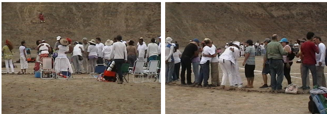
Momento de los abrazos de despedida

Continuamos con el acto de despedida, se rehizo el abrazo en orden de persona a persona y luego se brindó los alimentos previa magnetización. Finalmente procedimos a levantar el campamento desarmando las carpas, abordamos los buses y retornamos felices, contentos, satisfecho y renovados de mucha energía. En lo personal, con mi compromiso personal de seguir realizando mi misión personal que es de difusión y también mi labor de Instructor cuando las oportunidades y condiciones se den.