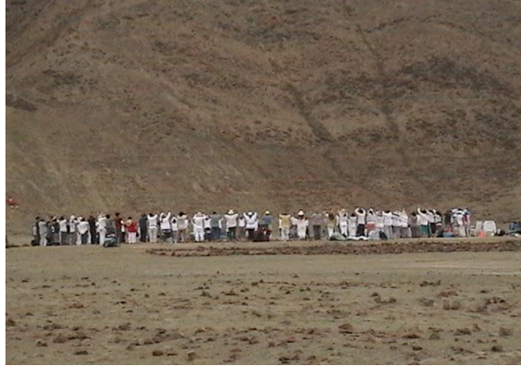
Saludo al Sol

Los trabajos se iniciaron con el saludo al Sol dirigido y conducido por el hermano Miguel Morales.